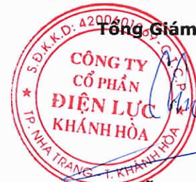
Nguyễn Cao Kỳ

Các thuyết minh kèm theo là một bộ phận hợp thành của báo cáo tài chính này