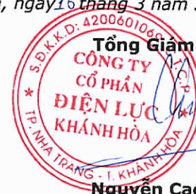
Nguyễn Cao Kỳ