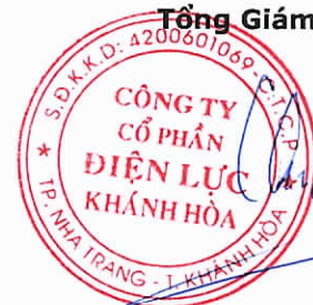
Nguyễn Cao Kỳ